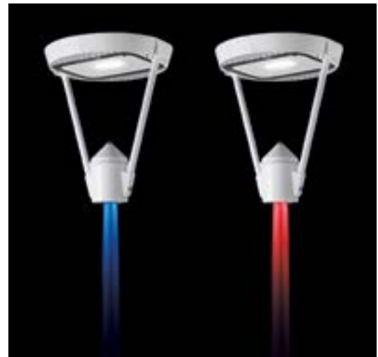
مدل‌های نور به لوله به رنگ‌های قرمز یا آبی بنا بر سفارش

Downward LED light the pole in red or blue upon request